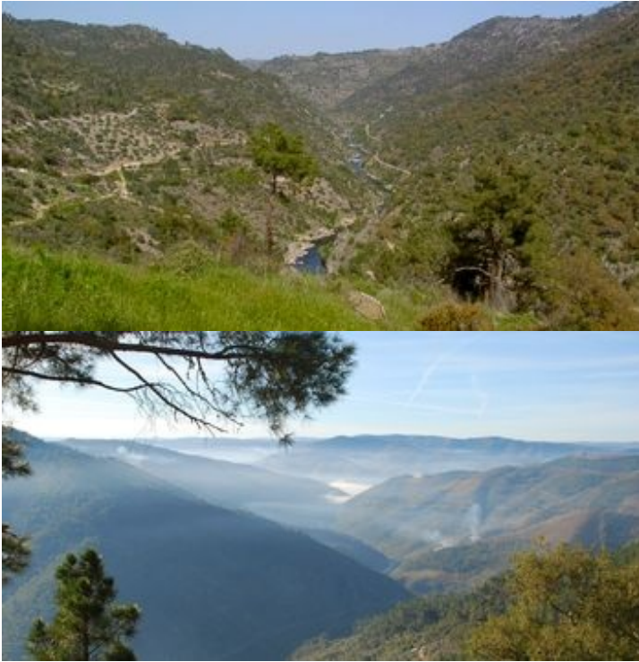
Aspetos do Parque Natural Regional do Vale do Tua.

Parque Natural Regional do Vale do Tua. Diploma de criação. Área. Caracterização.