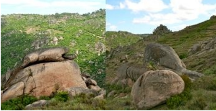
Fragas quartzíticas do Cachão, na margem direita do Tua (conc. de Mirandela). | Blocos de granito com aspeto zoomórfico (con. Carrazeda de Ansiães).

A área é caracterizada por uma diversidade climática que se traduz na paisagem vegetal, que apresenta, como vegetação natural potencial mais característica, bosques de sobreiro Quercus suber (com presença variável de azinheira e zimbro), nas áreas mais quentes e secas do vale, e bosques de carvalho-negral Quercus pyrenaica nas áreas mais frias e chuvosas do planalto e das principais serras.