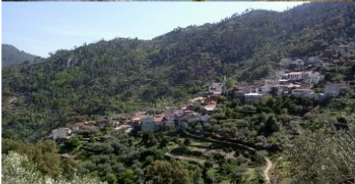
Quinta da Brunheda nas margens do Tua | Amieiro.

Importa destacar a atividade termal, a partir das nascentes das Caldas de Carlão/Santa Maria Madalena e da fonte termal das Caldas de São Lourenço, bem como um conjunto importante de quintas vocacionadas para a cultura da vinha, com potencialidades para o enoturismo, que têm vindo a desempenhar um papel cada vez mais relevante no