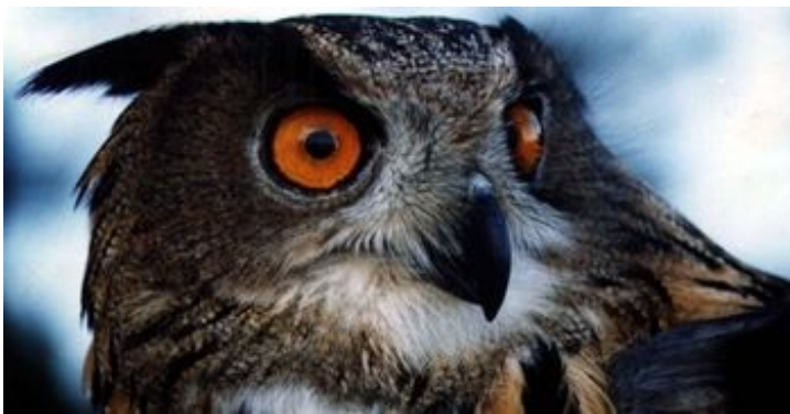
Digitalis purpurea subsp. amandiana - aspeto geral da planta e pormenor da inflorescência e das flores | Bufo-real.

A fauna da região envolvente do Vale do Tua é numerosa e diversificada, tendo sido até ao momento identificadas 943 espécies, sendo 744 de invertebrados terrestres, 15 de peixes, 12 de anfíbios, 20 de répteis, 123 de aves e 29 de mamíferos, das quais 14 são quirópteros (i.e. morcegos). A este total há ainda a juntar um número indeterminado de espécies de invertebrados aquáticos, agrupados em 72 famílias. Pela sua raridade e ou grau de ameaça, é de salientar, nos peixes, a presença da lampreia-dos-riachos [PDF 151 KB] ( Lampetra planeri [PDF 172 KB]) e do verdemã-do-norte ( Cobitis calderoni [PDF 116 KB]), nas aves, do chasco-preto [PDF 45 KB] ( Oenanthe leucura [PDF 146 KB]) e da águia-de-bonelli [PDF 338 KB] ( Aquila fasciata [PDF 161 KB]) e, nos mamíferos, do morcego-de-ferradura-mediterrânico [PDF 140 KB] ( Rhinolophus euryale [PDF 148 KB]). Outras espécies raras e ou emblemáticas da região são a toupeira-de-água [PDF 253 KB] ( Galemys pyrenaicus [PDF 137 KB]), o rato-de-cabrera [PDF 118 KB] ( Microtus cabrera [PDF 142 KB]), a lontra [PDF 128 KB] ( Lutra lutra ) e o bufo-real [PDF 336 KB] ( Bubo bubo [PDF 178 KB]).